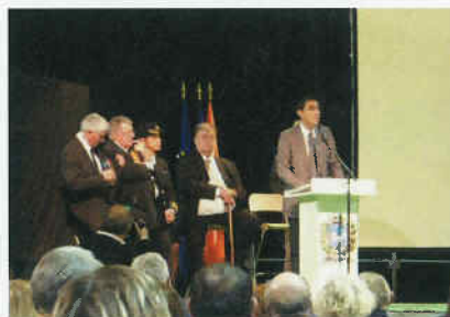
Cérémonie officielle - Cuxac-d'Aude

Clôture des célébrations par une cérémonie officielle Salle du Jeu de Paume avec l'intervention du Maire de Cuxac-d'Aude, du Président du SMMAR, du Président du Conseil Général, du Président du Conseil Régional et de Madame le Préfet, suivi d'une remise de gerbes aux monuments aux morts.