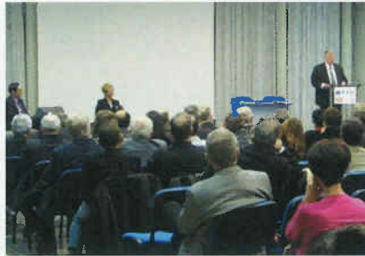
Conseil Général de l'Aude

sites Internet de l'Etat et du SMMAR et à la projection d'un film commémoratif.