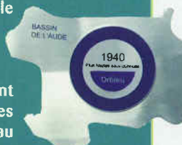
Nouveau modèle de repère de crue

Le SMMAR a défini un modèle standard qui matérialisera désormais le niveau atteint par les plus hautes eaux connues. Plus de 800 repères de crues, une fois fabriqués, seront mis à la disposition des communes soumises au risque inondation.