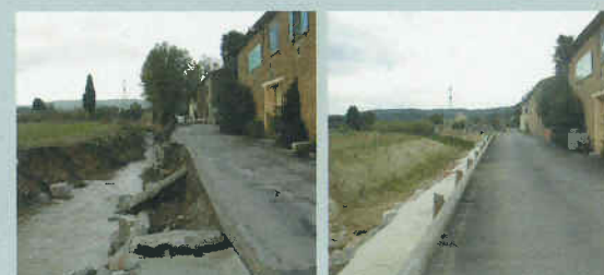
Situation au 16 novembre 2005

Le coût global de l'opération atteint 386 000 € HT.