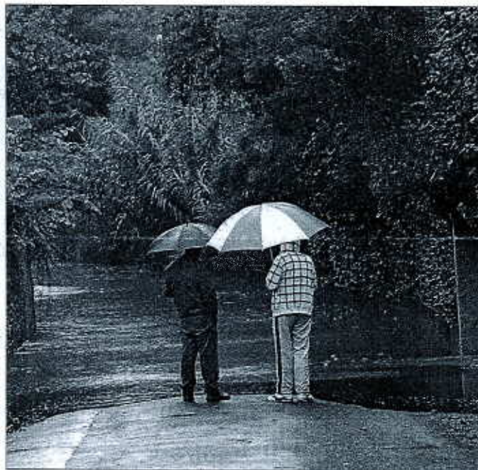
A ORNAISONS encore, deux riverains observent la rivière se déversant sur une route communale. Elle avait bien sûr été coupée. J. L.