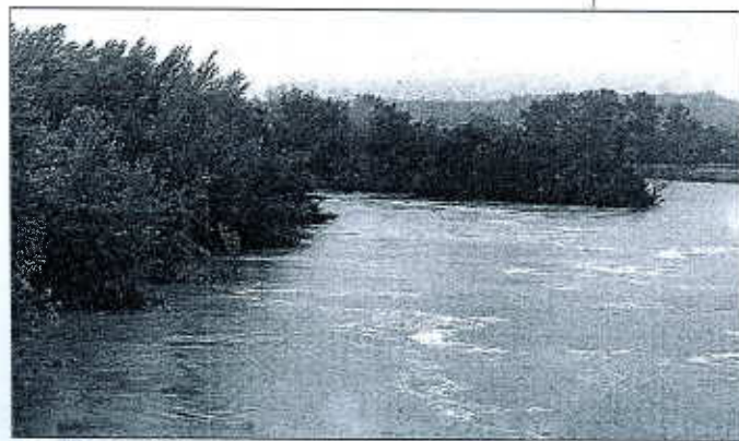
Aux environs de LUC-SUR-ORBIEU, la rivière épousait hier l'allure d'un fleuve. Le débit, cependant, n'avait rien de torrentiel. J. L.

néral avaient relevé une élévation de 50 cm en une heure. En milieu d'après-midi, cependant, il manquait encore une vingtaine de centimètres à l'Orbieu pour quitter son lit à Villedaigne. Néanmoins, au même moment, le cours d'eau s'était déjà déversé aux alentours de Luc-sur-Orbieu. Le spectacle était très impressionnant en dessous du pont reconstruit suite aux inondations de 1999 : de quoi réveiller de douloureux souvenirs.