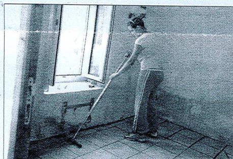
Le limon n'a pas épargné les rez-de-chaussée.