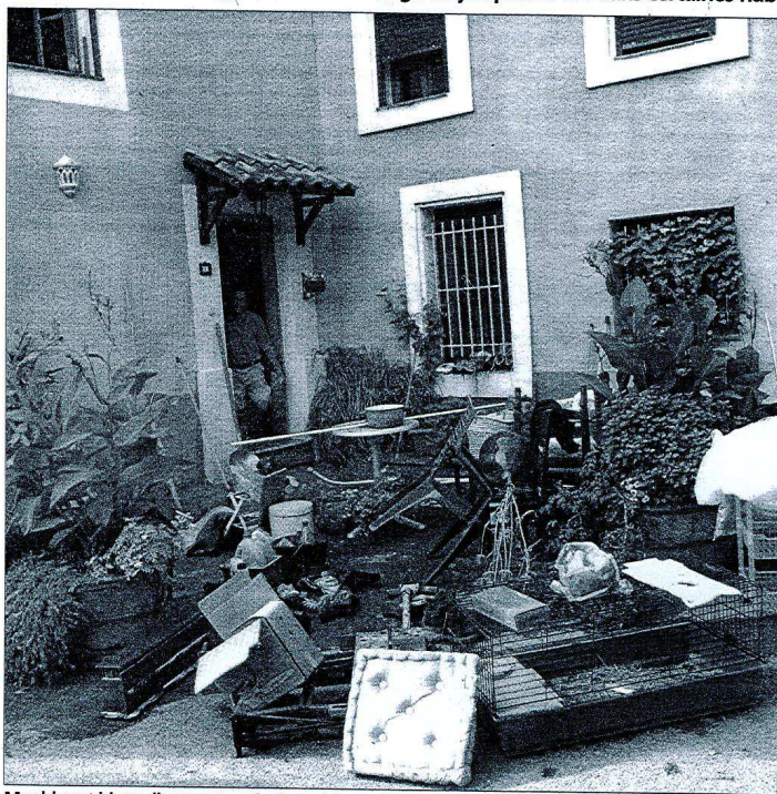
Meubles et biens divers entassés devant les maisons: un spectacle trop fréquent à Villedaigne.