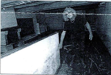
L'eau a laissé sa marque, montant parfois jusqu'à 80 cm.